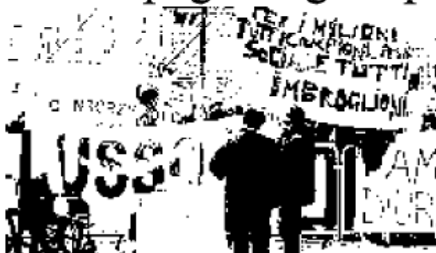
Protesta per il welfare